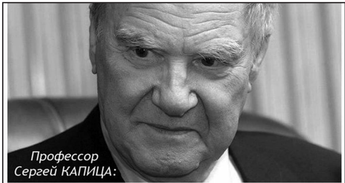
Профессор Сергей КАПИЦА:

Каждого «Бога-посредника» славословить под диктовку мировой закулисы, а изо всех сил вылезать из яра либерал-прохиндейства. И глушить лицемерные призывы к кротости жёстким гололом Иосифа Сталина, который слышат те, кто не поддавался «обезьянней» пропаганде: «Как вы допустили, что жертвенный героизм ваших прадедов, дедов, отцов, матерей, братьев, сестёр оказался растоптан штиблетами циничнейшего сообщества спекулянтов-гешефтмахов и служащих им мучиков в рясах, чалмах и т.п.?!»